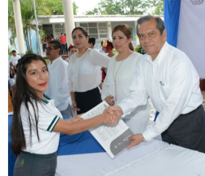
Satisfacción del estudiante